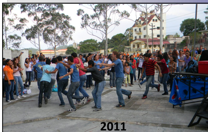
Complejo Deportivo Copan Galél, Santa Rosa de Copán